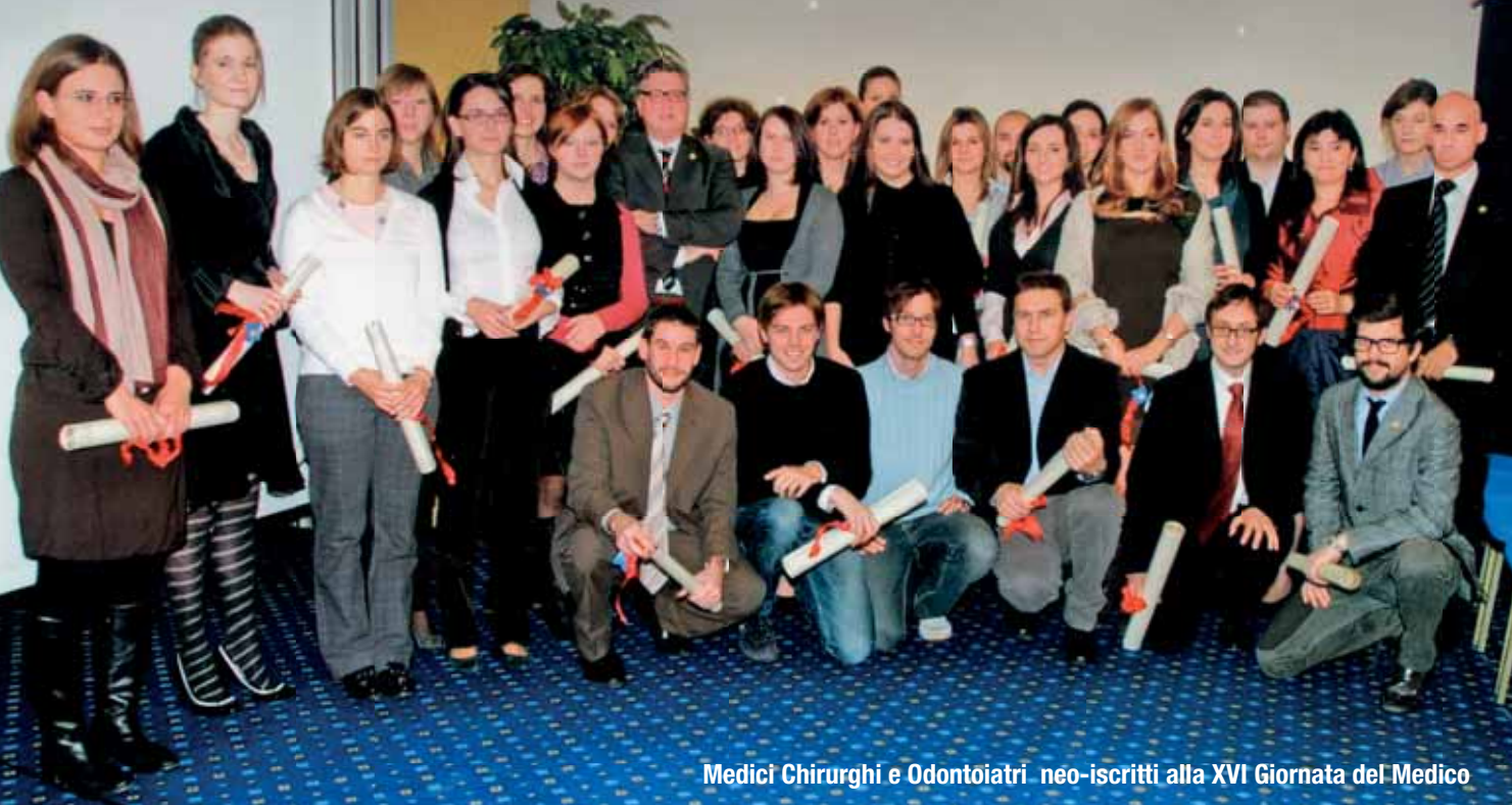
Medici Chirurghi e Odontoiatri neo-iscritti alla XVI Giornata del Medico

Il Presidente, il Consiglio dell'Ordine e la Commissione Albo Odontoiatri augurano a tutti i Colleghi ed alle loro famiglie i migliori Auguri di Buon Natale e di un Felice e Sereno 2011