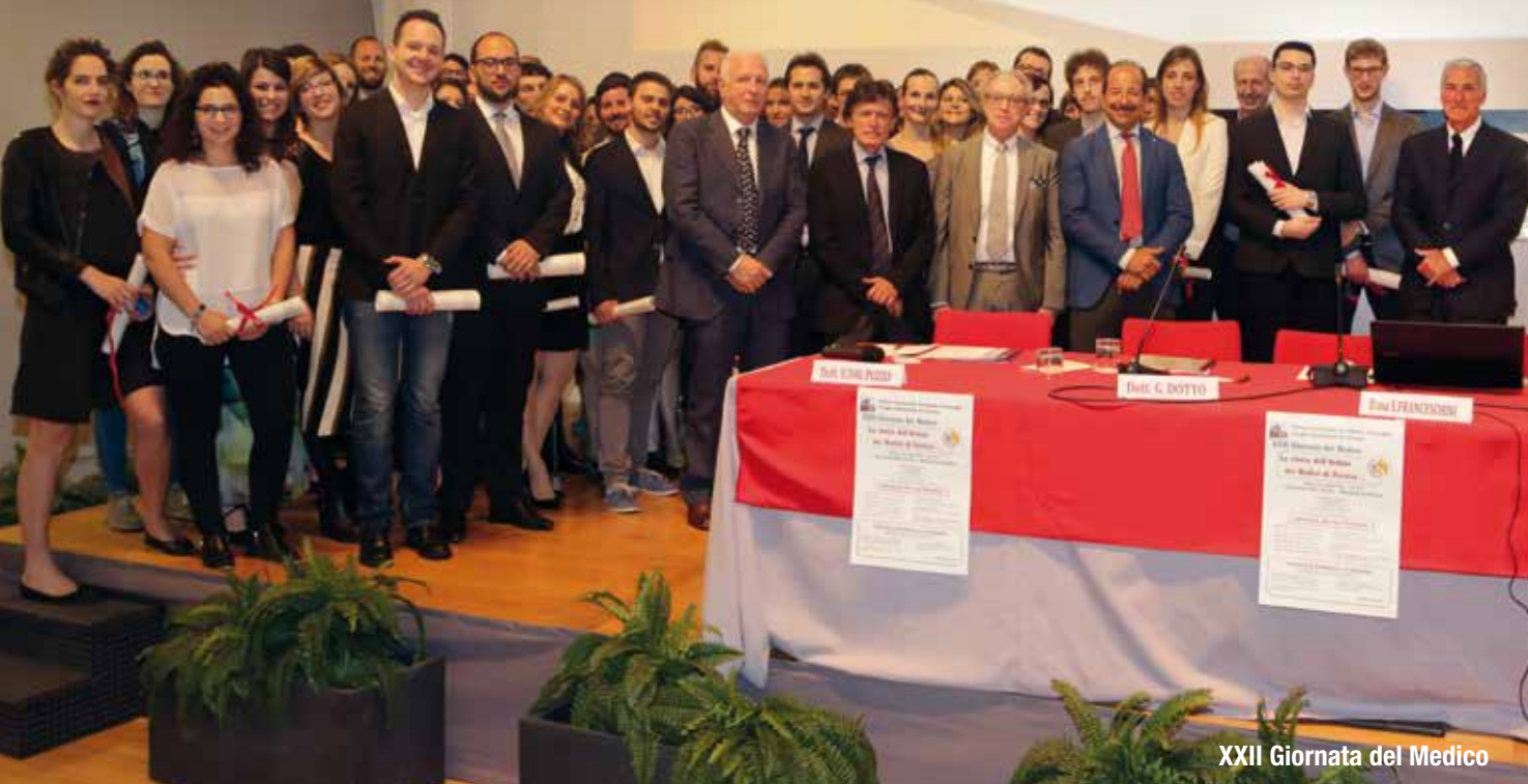
XXII Giornata del Medico